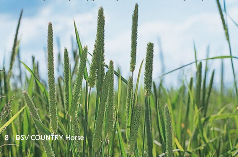
Kwiatostan tymotki łąkowej (po lewej widoczna wiechlina łąkowa)

Konie jako aktywne zwierzęta stadne mają dużą potrzebę ruchu. Należy brać to pod uwagę podczas ustalania wielkości kwatery pastwiskowej. Zasadniczo powinna ona być możliwie długa i prostokątna. Powierzchnia potrzebna dla jednego konia w zależności od systemu pastwiskowania wynosi pomiędzy 0,25 ha (przy wypasaniu dziennym), a 0,5 ha (przy wypasaniu całodobowym). Przy dziennym pobraniu świeżej masy na pastwisku w ilości 45-50 kg przez jednego konia ważącego 600 kg, tygodniowe zapotrzebowanie na powierzchnię pastwiska wynosi 700-750 m 2 . Bierze się tutaj również pod uwagę powierzchnię niedojadów. Jako wartość orientacyjną przyjmuje się: minimum 100 m 2 na jednego konia w jednym dniu pastwiskowania.